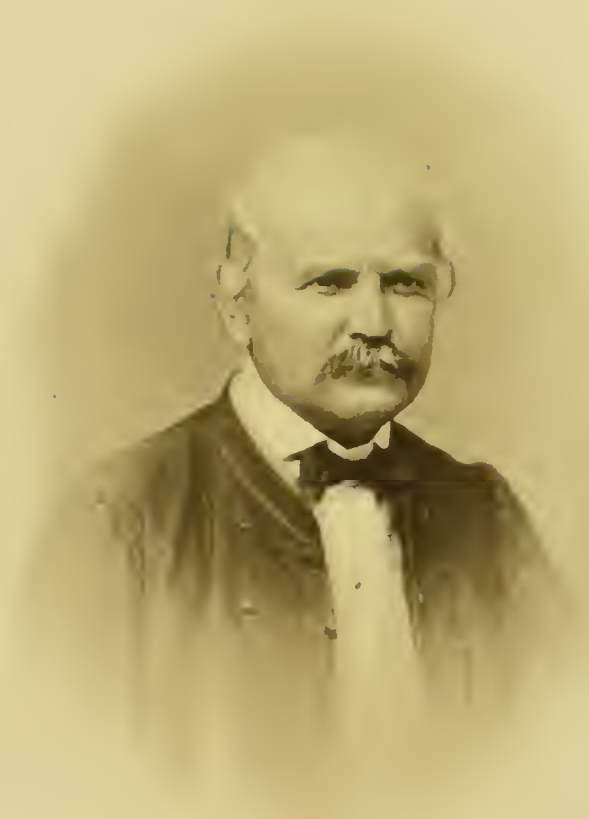
Nach einer Photographie von [illegible]